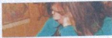
Resolver las dificultades de estudio