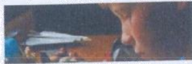
Técnicas de estudio: cada asignatura, su método