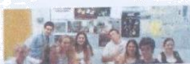
Programas para alumnos con alto rendimiento