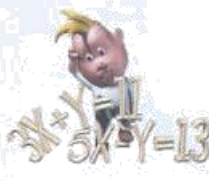
2016, ilustración de María I.

El CI es una puntuación general que relaciona el rendimiento en una escala de inteligencia diseñada a tal efecto (prueba de inteligencia) y la edad cronológica de la persona que realiza la prueba. Estas escalas están estar compuestas por pruebas de razonamiento verbal, matemático, espacial... Como se ha mencionado, el cociente intelectual es el resultado de una división entre la edad mental y la edad cronológica.