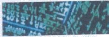
Redes sociales para aprender matemáticas